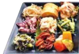
ほくろ屋自慢のお刺身と季節の酒肴が 楽しめる盛りだくさんのセット