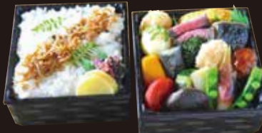
オリーブ牛のローストビーフと 旬のお惣菜を盛り込んだお弁当