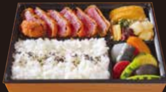
オリーブ牛 カツ弁当

コース R3 4,810円 (税込5,195円) モモ R4 3,160円 (税込3,413円)