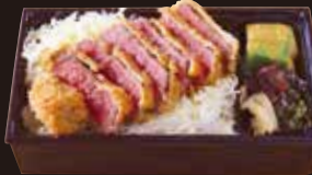
オリーブ牛 カツ重

コース R7 4,040円 (税込4,363円) モモ R8 2,610円 (税込2,819円)