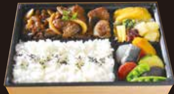
オリーブ牛 焼肉弁当