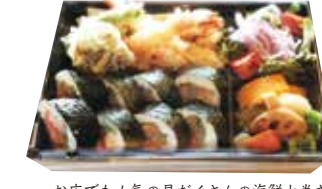
お店でも人気の具だくさんの海鮮太巻きと 天ぷら、日替わりのお惣菜のセット