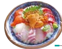
海鮮丼 スペシャル8種盛