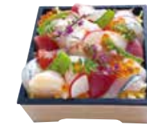
彩りも楽しめる魚介の宝石箱

K6 2,830円 (税込3,056円) 海鮮太巻き単品 K7 2,170円 (税込2,344円)