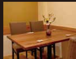
個室 / 4~12名様