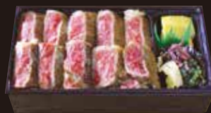
オリーブ牛 ステーキ重

コース R7 4,040円 (税込4,363円) モモ R8 2,610円 (税込2,819円)