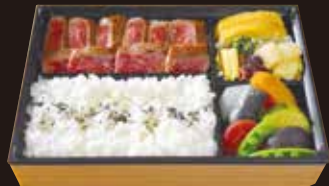
オリーブ牛 ステーキ弁当

コース R1 4,810円 (税込5,195円) モモ R2 3,160円 (税込3,413円)