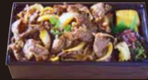
オリーブ牛 焼肉重

コース R9 4,040円 (税込4,363円) モモ R10 2,610円 (税込2,819円)