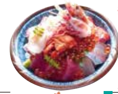
※海鮮丼の内容は 仕入れにより 変更する場合 があります