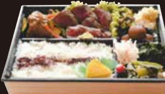
オリーブ牛 ステーキ&焼肉弁当