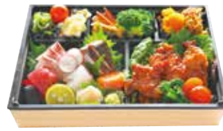
酒肴&お刺身セット

K1 お刺身&酒肴セット 3,820円 (税込4,126円) K18 お刺身1段のみ 2,310円 (税込2,495円)