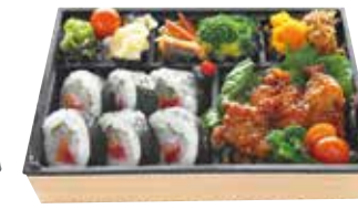
酒肴&海鮮太巻きセット