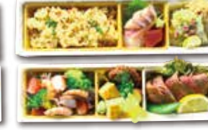
炊き込みごはん入り