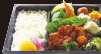
肉・魚介・野菜など多品目を幅広く、 量感も満足なお弁当