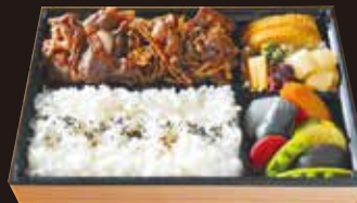
オリーブ牛 すき焼き弁当