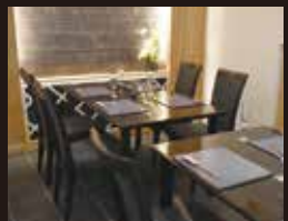
特別室 / 8名様(要予約)